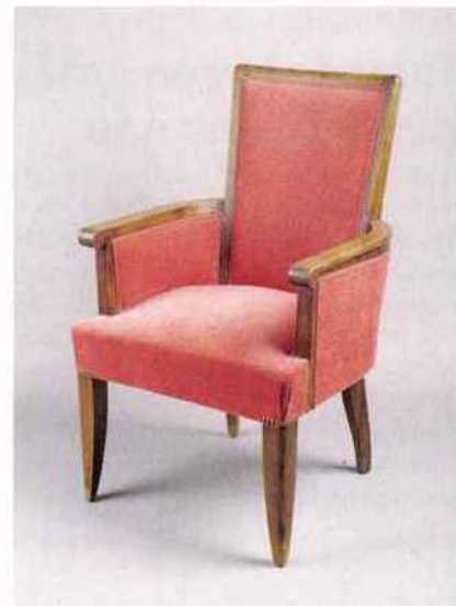
Fauteuil du salon fumoir de la classe cabine en 1949.