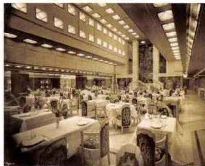
La salle à manger de la 1 re classe en 1927.