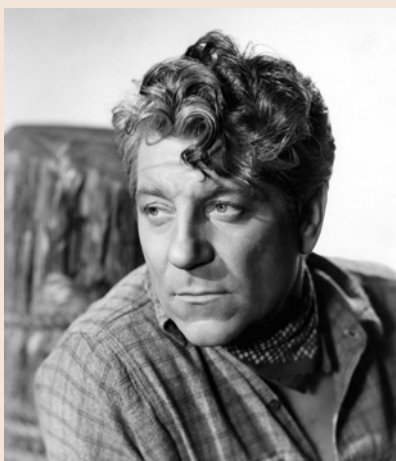
Jean Gabin sur le tournage de "Moonlight", 20th Century Fox, 1942.

Démonstrations de jouets optiques, lanterne magique, projections argentiques, etc. À partir de 3 ans (45 mn). Cinéma Landowski. Gratuit, sans réservation.